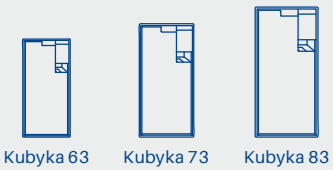
Kubyka 63 Kubyka 73 Kubyka 83